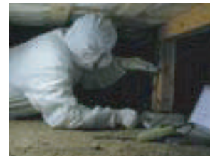
●床下での含水率測定風景